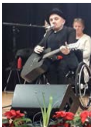
Musikern och kulturprofilen Eddie Wheeler.