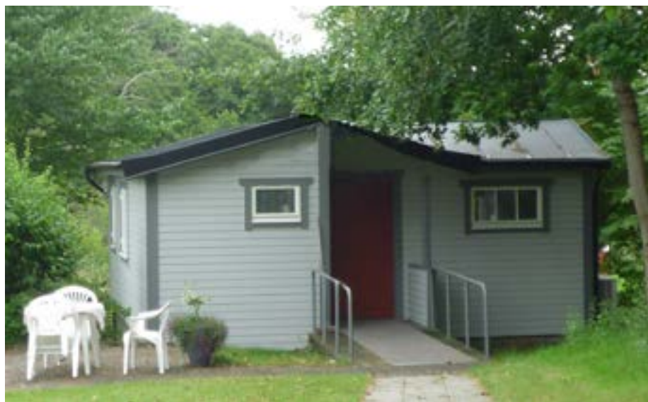
Lillstugan på Strannegården i Onsala.