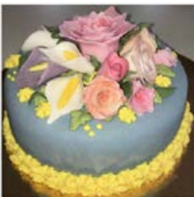
Den fina tårtan är gjord av Teresé.

Slutligen vill vi uppmana alla till att hålla sig informerade kring utvecklingen av coronaviruset via tillförlitliga källor, framförallt via Folkhälsomyndighetens hemsida www.folkhalsomyndigheten.se