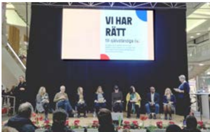
Politikersamtal med kommunalråd.

Anmälan: Till kansliet tel. 031-711 38 04 eller e-post: info.gbg@neuro.se