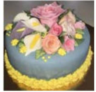
Tårtan är gjord av Teresé

Tid: Torsdag 16 april kl. 15.00 – 17.30 Plats: Kansliet, Arkitektgatan 2 Pris: 150 kr. Kursmaterial, goody-bag och fika ingår. Anmälan: senast 8 april. Via telefon 031-711 38 04 eller mail info.gbg@neuro.se . Betala till Pg 1 21 30-1, Märk betalningen "Tårta".