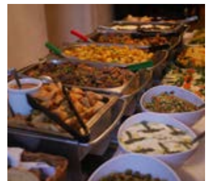
Restaurang Hamngatans populära aw buffé.

OBS! Restaurangen öppnar 17.00, begränsat antal platser.