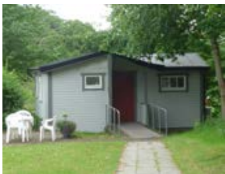
Lillstugan på Strannegården i Onsala

Medlemmar i Neuroförbundet Göteborg har möjlighet att hyra Lillstugan på Strannegården i Onsala, under den del av året vi inte har våra reguljära sommarveckor för gäster, alltså inte veckorna 24 - 34. Stugan är anpassad och utrustad med pentry, två sovplatser och dusch.