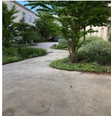
En del av utemiljön