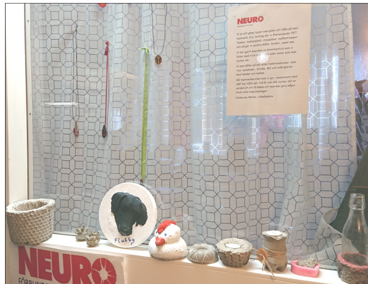
Liten utställning med smycken och föremål som tillverkats under våren.