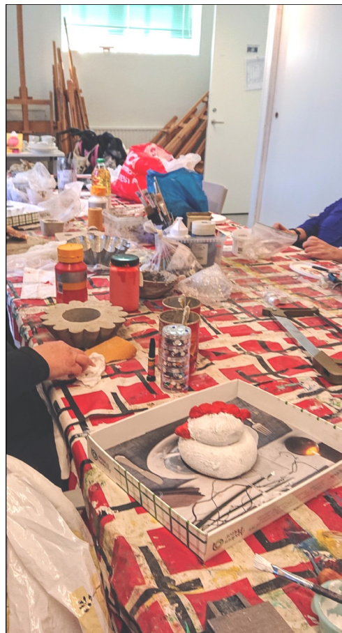
I hantverkssalen på ABF