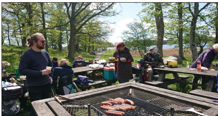
Korvgrillning på Ängsö