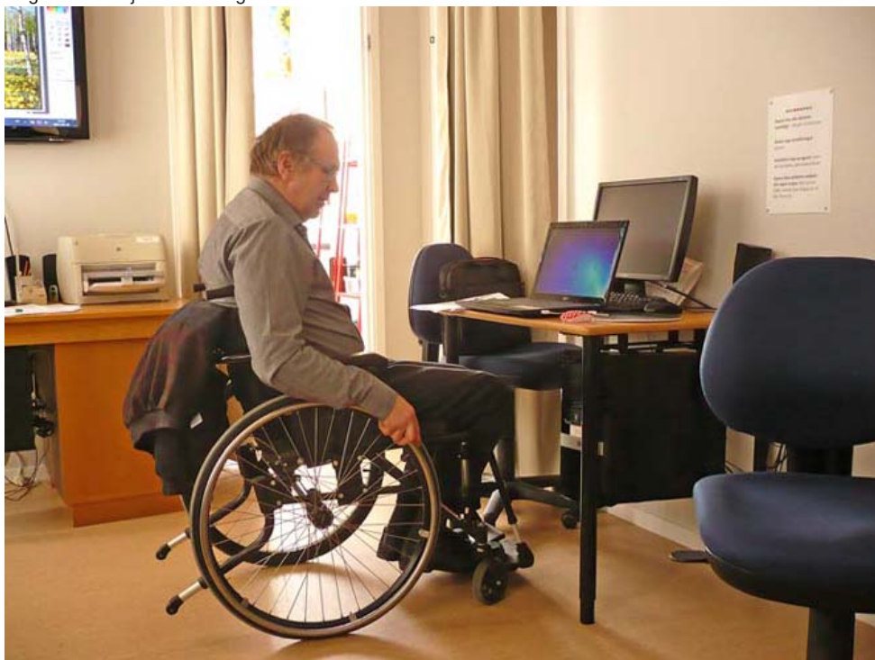
En av de flitiga deltagarna