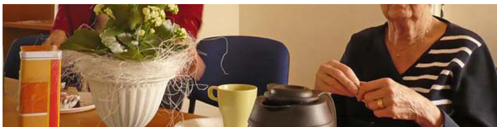
Några av de nöjda kursdeltagarna