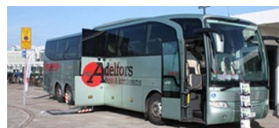
Bussen som hämtar oss!

Programmet är bara preliminärt än, men läs det gärna på hemsidan!