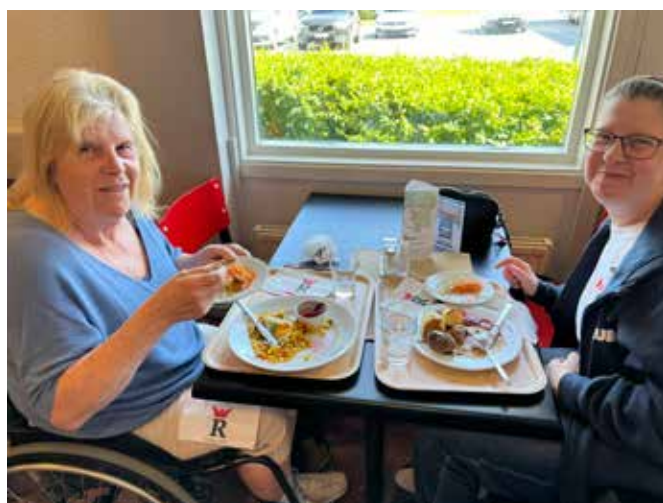
Att en lunch på Rasta i Arboga kan resultera i såna här glada minner hade vi kanske inte trott.