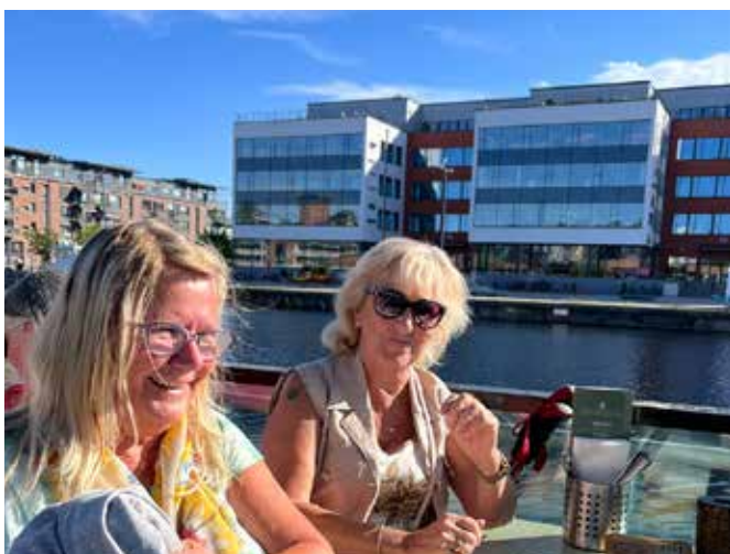
Sista natten (läs kvällen) med gänget, vi frekventerade restaurangen Ankdammen som låg mysigt vid vattnet i inre hamn.