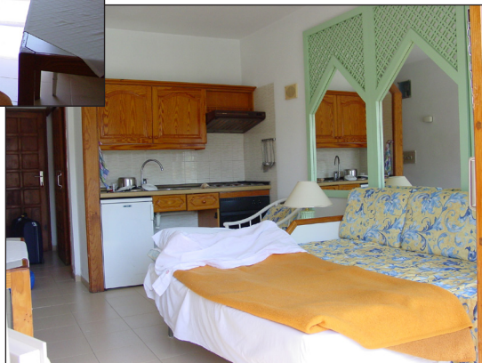
Kök och bäddsoffa