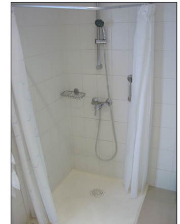
Anpassad dusch & toalett