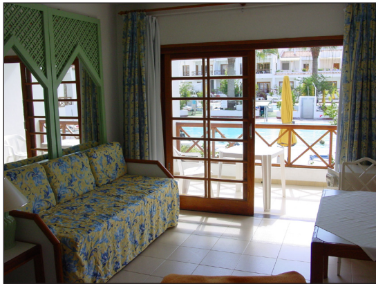
Utsikt mot poolen

När man kommer till hotellet finns ibland svensktalande personal i receptionen. Vid ankomsten kräver hotellet att man lämnar sitt pass för deras registreringsuppgifter. Passet återfås i receptionen nästa dag. I receptionen kan man beställa de extratjänster man behöver. Vid ankomsten kan det vara bra att be om koden till kassaskåpet om man tänker hyra detta. Be också att få ett passerkort till nedre porten, som är en genväg när man ska ner till strandpromenaden. Detta passerkort är gratis.