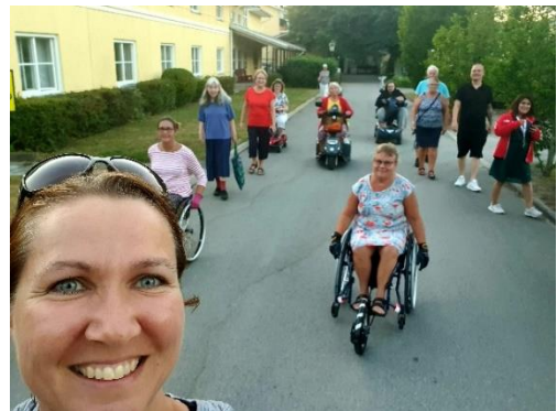
Kick-off, Valjeviken aug 2020

Strategin har redan från början varit att få föreningarna att prata med varandra - för att dela erfarenheter att bygga vidare på, stötta och inspirera varandra. Detta började redan vid det första inledningsmötet i Växjö i slutet av januari 2020 och det fortsatte i samma anda vid kickoffen i Valjeviken augusti samma år.