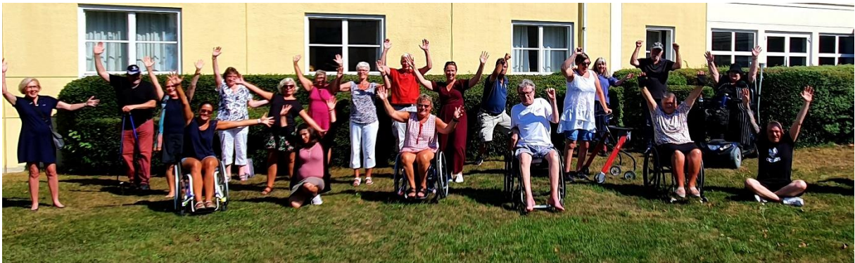
Kick-off Valjeviken aug 2020